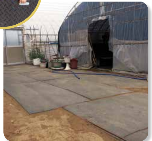
ビニールハウスアプローチ養生