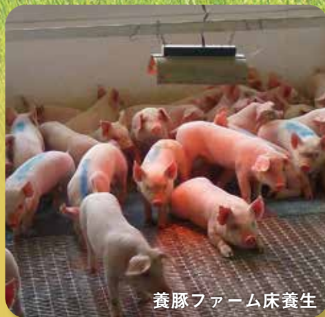
養豚ファーム床養生