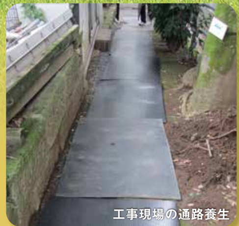
工事現場の通路養生